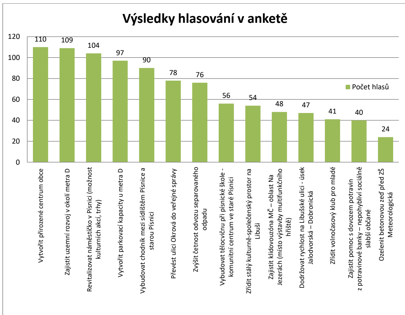
Graf č. 2: