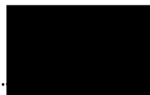
Ivana Sykorová ředitelka MŠ Lojovická (za příjemce dotace)

Mateřská škola Lojovická Lojovická 557/12, Praha 4 - Libuš PSČ 142 00 IČO 60437928 tel číslo 241 471 378