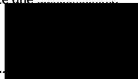
Mgr. Jiří Koubek starosta městské části Praha-Libuš (za poskytovatele dotace)