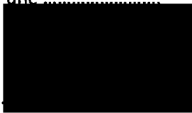
Mgr. Jiří Koubek starosta městské části Praha-Libuš (za poskytovatele dotace)