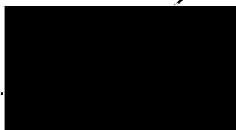
starosta městské části Praha-Libuš (za poskytovatele dotace)