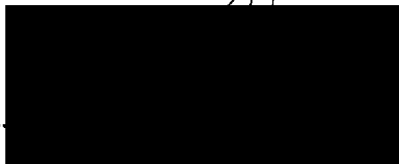
starosta městské části Praha-Libuš (za poskytovatele dotace)