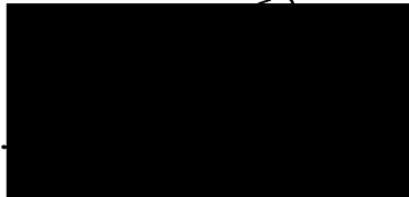
starosta městské části Praha-Libuš (za poskytovatele dotace)