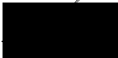
starosta městské části Praha-Libuš (za poskytovatele dotace)