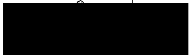
ředitel Základní školy Meteorologická (za příjemce dotace)