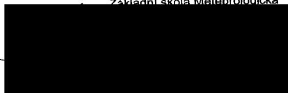
ředitel ZŠ Meteorologická (za příjemce dotace)

V Praze dne ..... 17.6.2019 základní škola Meteorologická