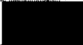
Mgr. Jiří Koubek starosta městské části Praha-Libuš (za poskytovatele dotace)