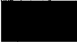
Mgr. Jiří Koubek starosta městské části Praha-Libuš (za poskytovatele dotace)