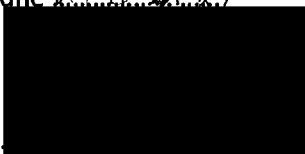
Mgr. Jiří Koubek starosta městské části Praha-Libuš (za poskytovatele dotace)