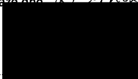
Mgr. Jiří Koubek starosta městské části Praha-Libuš (za poskytovatele dotace)