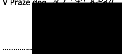
Mgr. Jiří Koubek starosta městské části Praha-Libuš