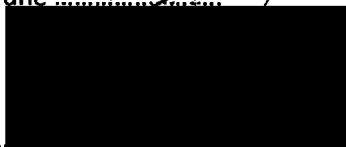
Mgr. Jiří Koubek starosta městské části Praha-Libuš (za poskytovatele dotace)