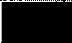
Mgr. Jiří Koubek starosta městské části Praha-Libuš