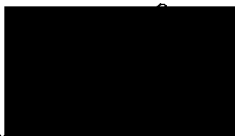
Mgr. Jiří Koubek starosta městské části Praha-Libuš (za poskytovatele dotace)