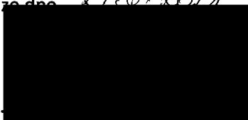
Mgr. Jiří Koubek starosta městské části Praha-Libuš (za poskytovatele dotace)