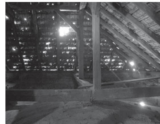
➔ Klenba libušské pošty shora.