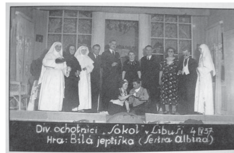
→ Libušský sokolský divadelní soubor ve hře Bílá jeptiška dne 4. dubna 1937.

Na Libuši se již od konce první světové války hojně hrálo ochotnické divadlo. A to hned několika zájmovými spolky! Jedním z nich byli například sokolové. Libušská odbočka kunratického sokola vznikla již v roce 1912. Její členové se po první světové válce scházeli nejdříve po dva roky v restauraci U Hertlů, ale z neznámých důvodů přesídlili do restaurace U Novotných. Zde také za tehdy typicky skromných podmínek sokolové cvičili, než s pomocí libušských občanů v roce 1929 vystavěli dnešní sokolovnu. Ale již o dva roky dříve, v roce 1927, získali sokolové