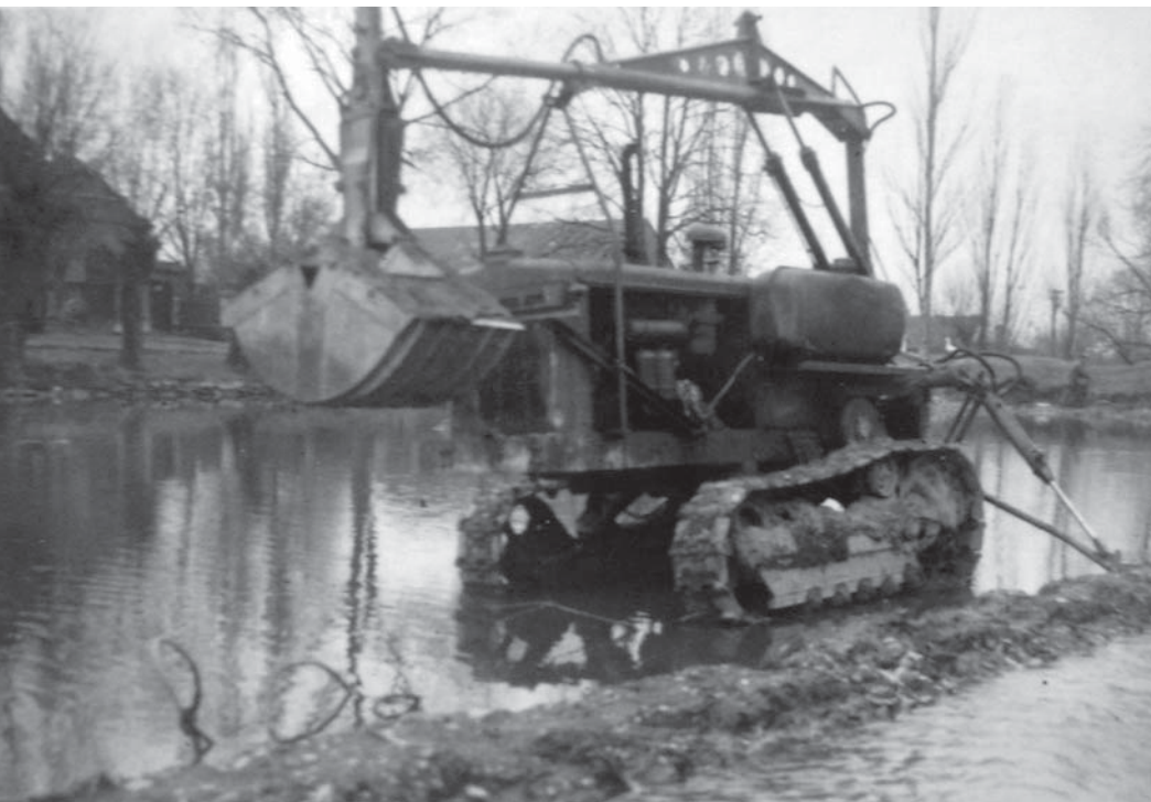
↑ V 60. letech se pokoušel odbahnit rybník tento stroj. → Rybník před vyčištěním cca 1972...