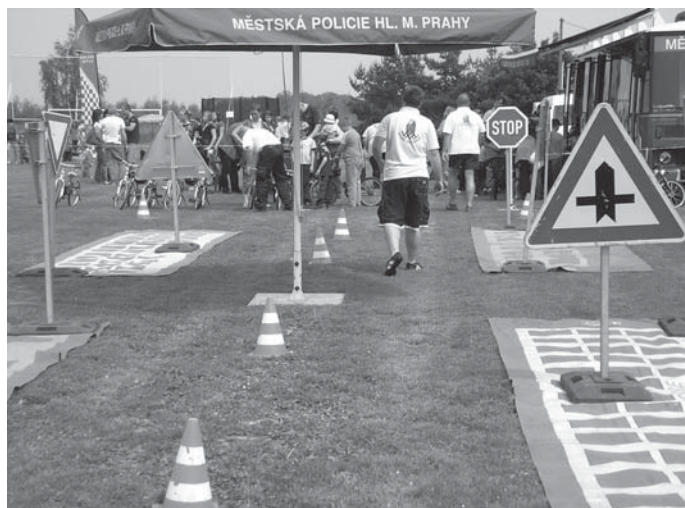
Ilustrační foto z Dětského dne 2010, který na fotbalovém hřišti v Písnici pořádala MČ Praha-Libuš.

V pátek 28. května odjelo po sváčině 25 dětí na dopravní hřiště, kde nás už očekávaly dvě milé pracovníce muzea. Děti si prohlédly prostředí hřiště (opravdové silnice, křižovatky, fungující semafore, dopravní značky, přechody apod.). Pracovnice muzea