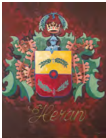
Erb rodiny Heranů.