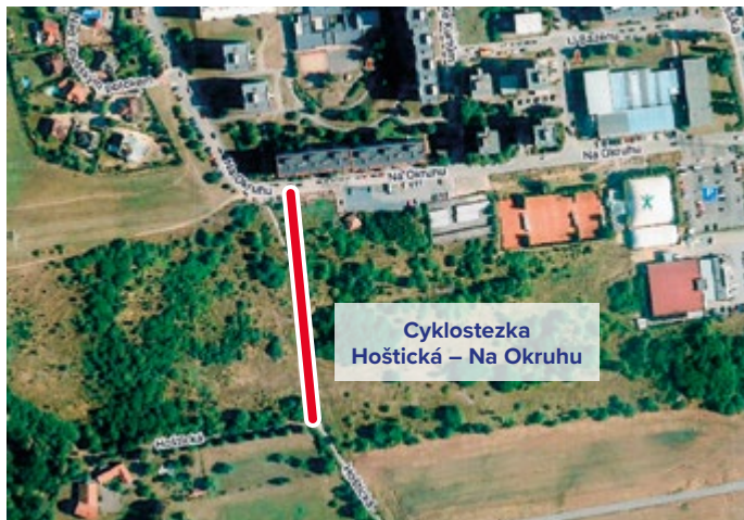
Cyklostezka Hořtická – Na Okruhu

Stejná složka MHMP chystá rekonstrukci rybníka Obecnák v centru Písnice. Nynější předpoklad je takový, že stavební práce budou zahájeny v dubnu tohoto roku. V předstihu, tj. nejpозději do konce března, dojde k pokácení stromů na hrázi. Samozřejmě, že na základě povolení kácení, jemuž předcházelo několik dendrologických posudků. Zhotovitelem budou Lesy hl. m. Prahy. Informační tabule je objednána a měla by být osazena včas.